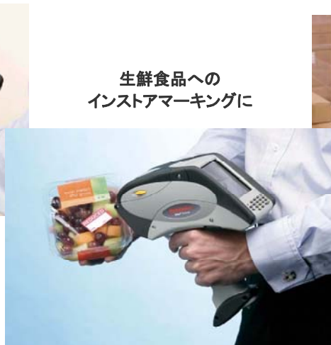
生鮮食品への インスタマーキングに