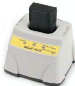
9462 M-603X用 バッテリー充電器