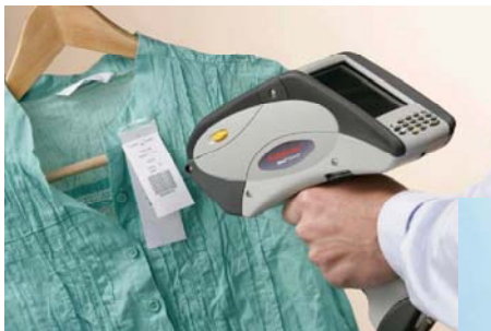
売り切り商品等の EAN128売変処理に