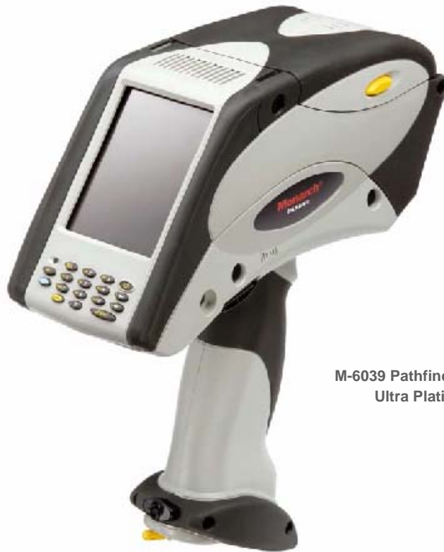
M-6039 Pathfinder Ultra Platinum