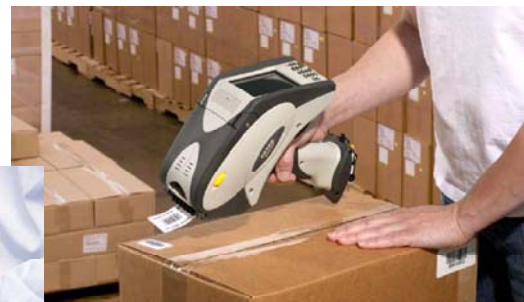
配送業の荷札発行や 貨物追跡用に