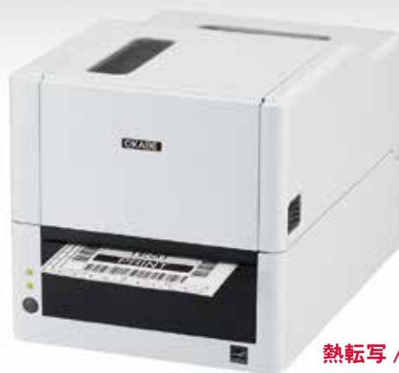
熱転写 / 感熱兼用タイプ EC320T / EC330T