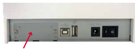
工場オプションで有線 LAN・無線 LAN やシリアルも追加可能

USB を標準装備しています。工場オプションでインターフェースボードを差し替えることにより、豊富なインターフェースが選択可能です。有線 LAN やシリアルはもちろん、無線 LAN(2.4G/5G) にも対応。ハンディターミナル、タブレット端末、スマートフォンからワイヤレスで印刷する際の使いやすさを実現しています。