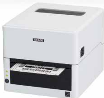
感熱タイプ EC320 / EC330