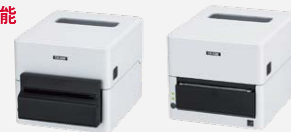
● 一体型カッター搭載モデル

ラベルを印刷した後にカットできる カッターオプション 一体型カッターモデル 分離型カッター (EC320 / EC330 のみ)