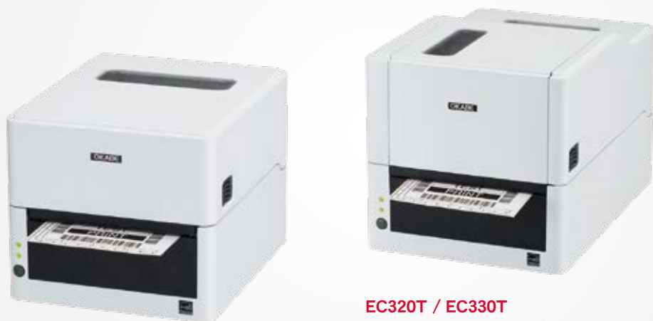
EC320 / EC330 感熱タイプ