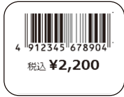
② JAN コード・価格 (総額表示)