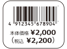
④ JAN コード・価格 (本体・総額併記)