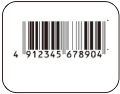
① JAN コードのみ

サイズ：縦 25mm×横 32mm（1 ページ 横 2 列 2 面付） 紙管内径 25mm 用紙外径 130mm 品番：401011111686