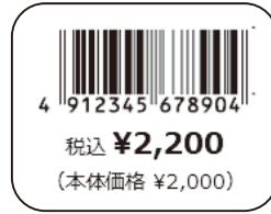
③ JAN コード・価格 (総額メイン・本体併記)