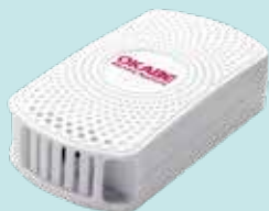
温湿度センサービーコン BLE-TM530