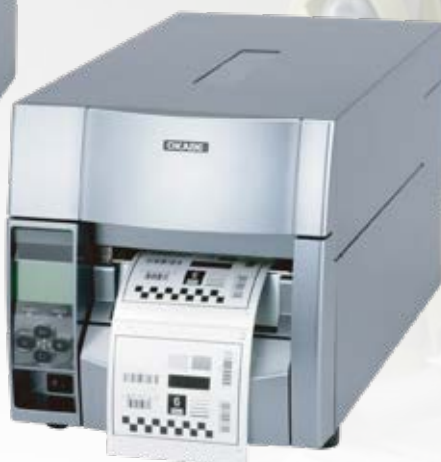
Theta730 Type II 300dpi