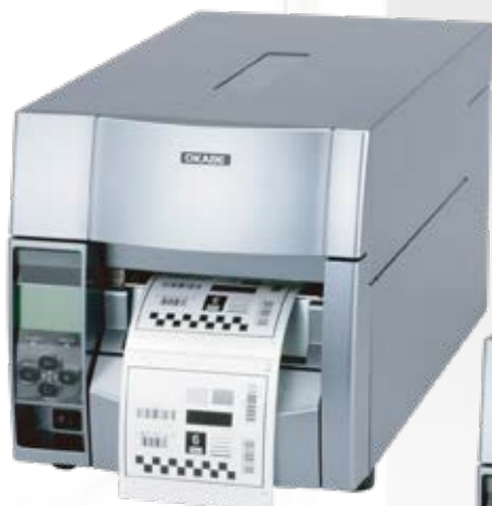
Theta720 Type II 203dpi