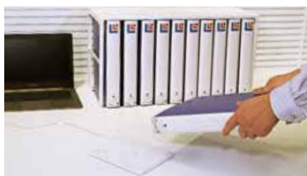
オフィス ▶ 書類・文書管理