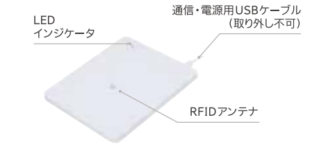
TS100 / TS100F