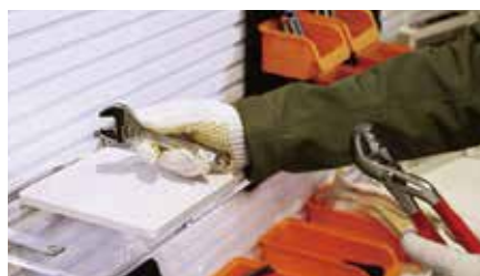
メンテナンス業 ▶ 工具管理