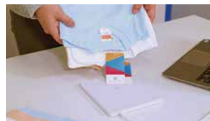
小売業 ▶ 会計・在庫管理