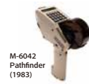
M-6042 Pathfinder (1983)