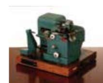
モデル67 電動式プリンター (1962)

2001年より米国ゼブラ・テクノロジーズ社のプリンター販売開始、2008年にはプレミアパートナーに認定される。近年ではRFID、BLEなど無線技術を活用した製品の販売とソリューション