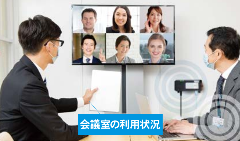
会議室の利用状況