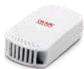
BLE-TM530 温湿度センサー付BLEビーコン