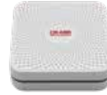
BLE-TM541 ロングライフバッテリーBLEビーコン