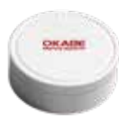
BLE-TM511 加速度センサー付BLEビーコン