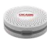
BLE-TM500 ノーマルタイプBLEビーコン