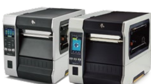
ZT400シリーズ/ZT400 RFIDシリーズ