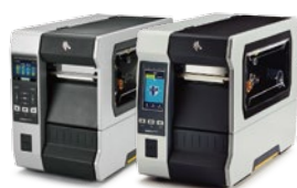
ZT600シリーズ/ZT600 RFIDシリーズ