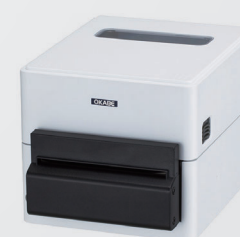
● 一体型カッター搭載モデル