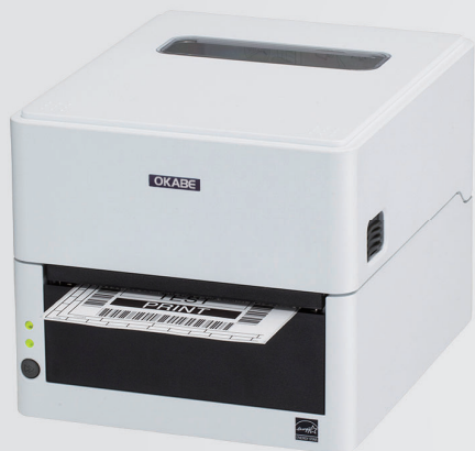
EC320 / EC330 感熱タイプ