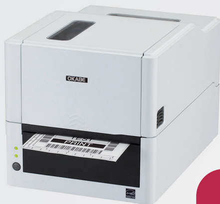
EC320T / EC330T 熱転写 / 感熱兼用タイプ