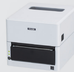
● 分離型カッター搭載モデル